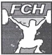
TABLA DE DISTRIBUCIÓN DEFINITIVA DE LA FEDERACIÓN CANARIA DE HALTEROFILIA